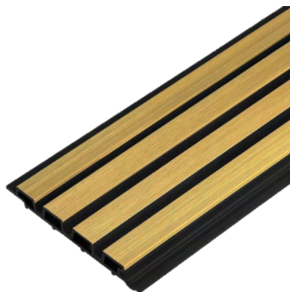
Light Oak / Černý